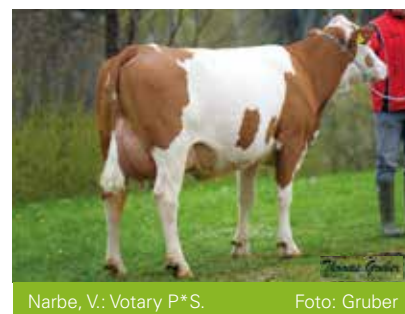
Narbe, V.: Votary P*S.