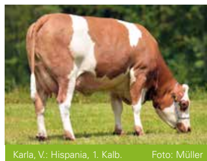
Karla, V.: Hispania, 1. Kalb.