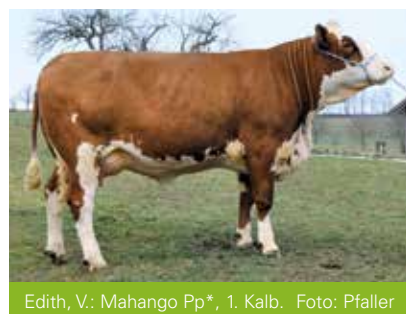
Edith, V.: Mahango Pp*, 1. Kalb.