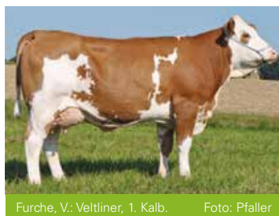
Furche, V.: Veltliner, 1. Kalb.