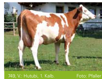
749, V.: Hutubi, 1. Kalb.