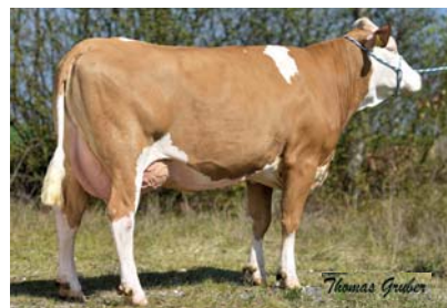
◆ Thea, V: BFG WALFRIED, 1. Kalb.