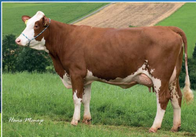
◆ Milch-TYP: Astrid (V: BFG SALDANA).