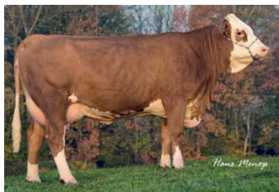
◆ Ramboza, V: BFG ZAPATERO, 1. Kalb.