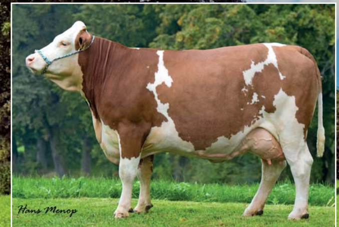
◆ Kraft-TYP: Blue Ray (V: BFG MORITZBURG).