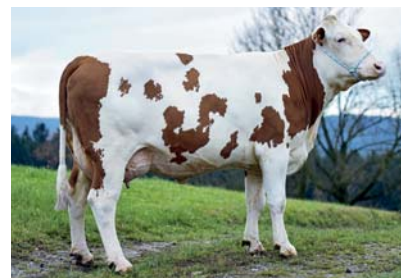
◆ V: BFG WENDLINGER, 1. Kalb.