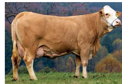
◆ 96810, V: BFG RIJEKA, 3. Kalb.