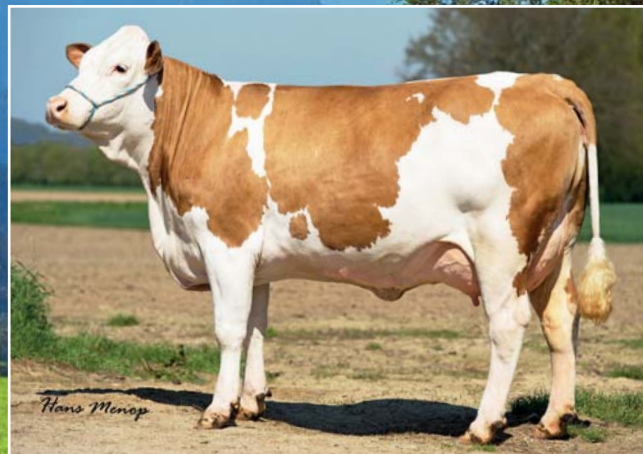
◆ Allround-TYP: Ufo (V: BFG WOLGASAND).